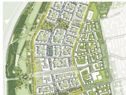
2. Realisierungsabschnitt Freiham Nord